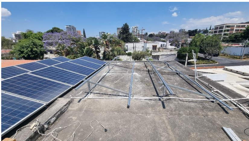
Ensuite nous avons mis en place 2 nouvelles lignes de panneaux pour créer une nouvelle série de 12 panneaux.

Chaque étape est pensée pour maximiser notre production d'énergie. Le but étant de répondre aux besoins croissants de cette communauté à laquelle on a la sensation d'appartenir.