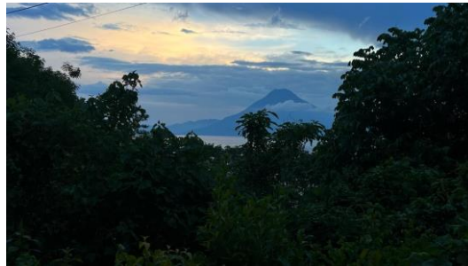
Figure 2 : cocher de soleil sur le lac Atitlan

Elles sont parties le vendredi pour rejoindre le Lac Atitlan direction Panajachel. Enormément de circulation, 5h de voiture à cause du jour de l'armée qui avait lieu le lundi. Samedi matin réveil 5h40 pour faire le sunrise en paddle, puis visite de la ville Panajachel avec un repas typique de là-bas (le Ceviche un mélange d'oignons, de tomates, de crevettes, crabes et poulpes avec une sauce secrète). Le soir direction San Pedro afin de dire une dernière fois aurevoir au lac. Là-bas, elles ont rencontré une couturière qui est venue en France faire une exposition. Un article a été fait sur elle (page 5).