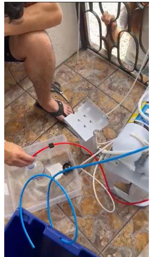
Test de filtration avec la machine