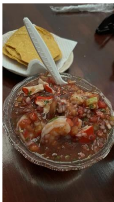
Figure 8 : Repas traditionnel Ceviche