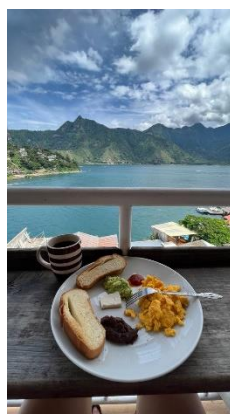
Figure 7 : petit déjeuner vu sur le lac