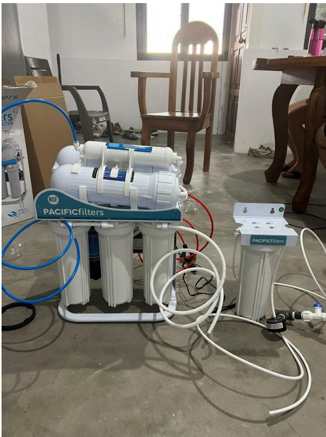
1Filtre 5 étapes

Les conditions d'utilisations du filtre demandent une pression entre 1 bar et 3 bars. Après nos calculs, nous avons trouvé que la pression en sorti du réservoir est suffisante. Nous ne pourrons sûrement pas tester et tout mettre en place car les travaux pour le toit de l'orphelinat (l'endroit ou doit aller les machines et notre système) ne seront pas terminés avant notre départ.