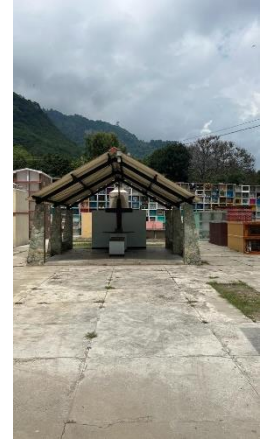
Figure 3 : Cimetière de Panajachel en couleur