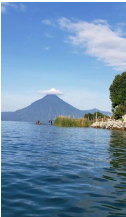
Figure 5: Vu en faisant du paddle

Elles sont parties le vendredi pour rejoindre le Lac Atitlan direction Panajachel. Enormément de circulation, 5h de voiture à cause du jour de l'armée qui avait lieu le lundi. Samedi matin réveil 5h40 pour faire le sunrise en paddle, puis visite de la ville Panajachel avec un repas typique de là-bas (le Ceviche un mélange d'oignons, de tomates, de crevettes, crabes et poulpes avec une sauce secrète). Le soir direction San Pedro afin de dire une dernière fois aurevoir au lac. Là-bas, elles ont rencontré une couturière qui est venue en France faire une exposition. Un article a été fait sur elle (page 5).