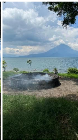
Figure 4 : Visite de la ville Panajachel en profondeur