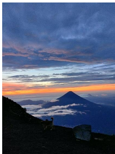
Levé du soleil au sommet