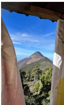
Vue de nos toilettes