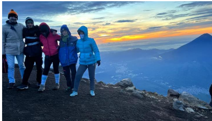
Groupe Fatima au sommet de l'Acatenango