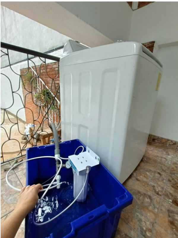
Dispositif du test

La semaine prochaine, nous recevrons le prochain filtre qui est plus complet, afin d'effectuer les derniers tests pour savoir si le savon peut effectivement être filtré.