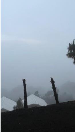
Mur de brume sur notre refuge

Redescente finale en 2h30 ravi de voir l'arrivée car exténué mais ayant vécu une expérience insolite.