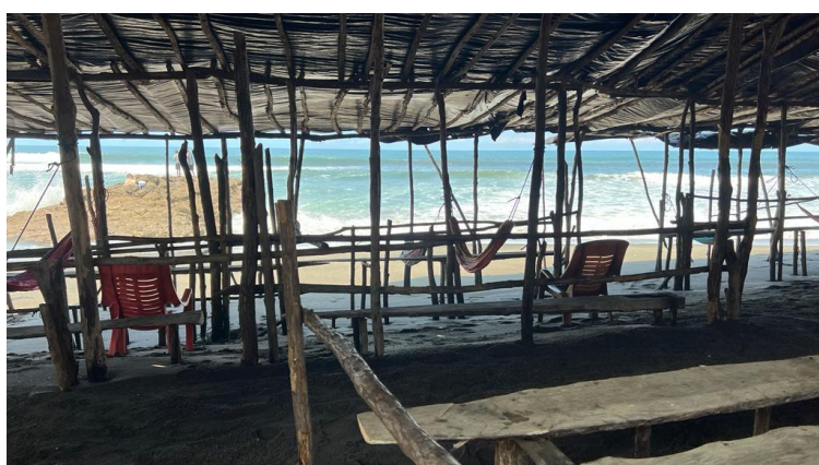
Plage du pacifique, Nicaragua