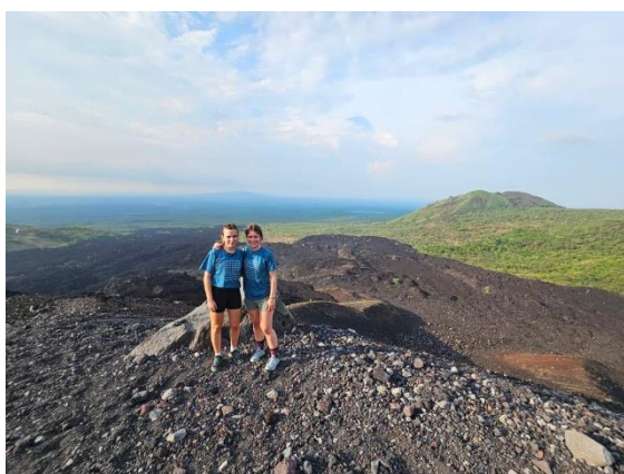
Sommet du volcan, Nicaragua

De l'autre côté, les gars sont partis avec un guide sur les routes goudronnés (ou pas) du Guatemala tout en bravant la pluie. Ils ont pu contempler les magnifiques paysages depuis les hauteurs du lac, les champs dans les vallées et les courbes des routes de montagne.