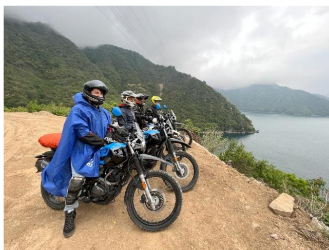
Vue du lac Atitlan depuis ses hauteurs