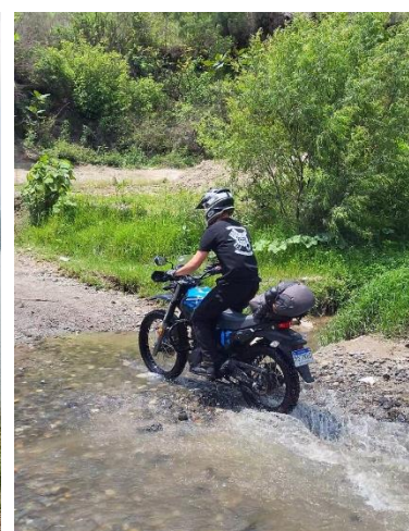
Passage à gué