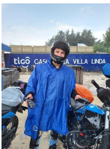
Equipement de pluie pour la moto