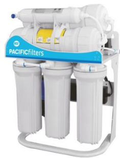
Filtre 5 étapes

L'orphelinat possède déjà des réservoirs de 2000L que nous pourrions utiliser ainsi que de panneau solaire pour alimenter nos pompes lorsque la luminosité est suffisante.