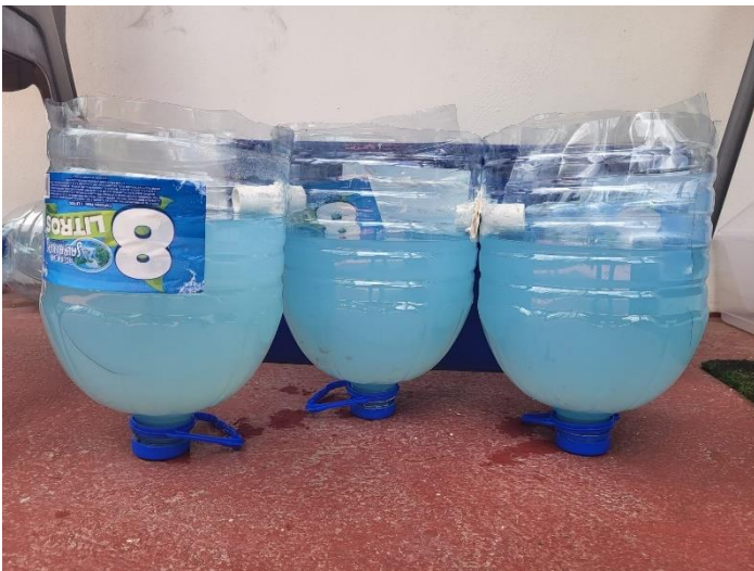
Résultat Test Lessive classique

Nous avons une autre solution que nous envisageons qui devrait fonctionner d'avantage que celle-là.