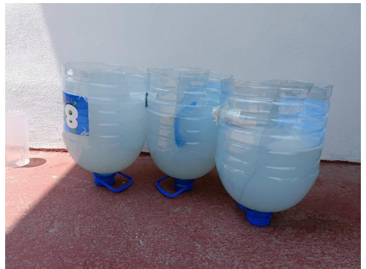
Résultat test savon noir traditionnel

Comme l'on peut voir si nos tests, les résultats ne sont pas concluants. Pour la lessive classique, le coagulant a légèrement fonctionné, on peut voir des dépôts au fond des bacs mais ce n'est pas suffisant à supprimer l'ensemble du savon dans l'eau et refaire une machine avec la même eau. Quant au savon noir traditionnel ce fut un échec, il n'y a pas eu de coagulation.