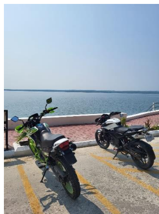
Motos louées pour le tour du lac