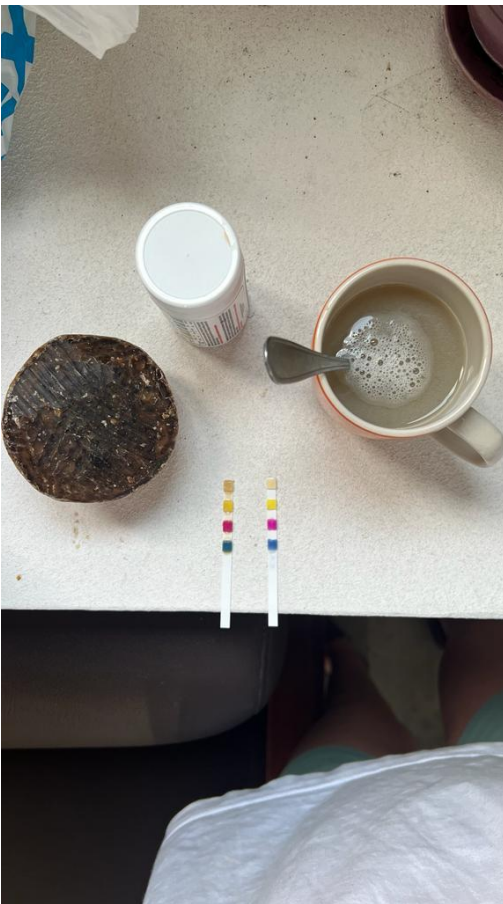
Test PH Savon noir

En parallèle nous avons réalisé les récipients qui permettrons que créer les bacs de décantation.