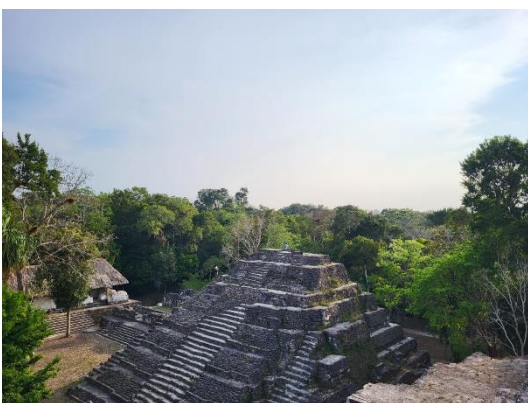
Temple Maya dans la cité de Yaxha