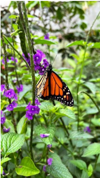
Papillon réserve naturelle

De l'autre côté, les gars se sont retrouvés tous les 2 à Flores. Ils se sont rendus dans l'ancienne cité maya du nom de Yaxha. Le lendemain, ils ont loué des motos pour faire le tour du Lac Petén Itza.