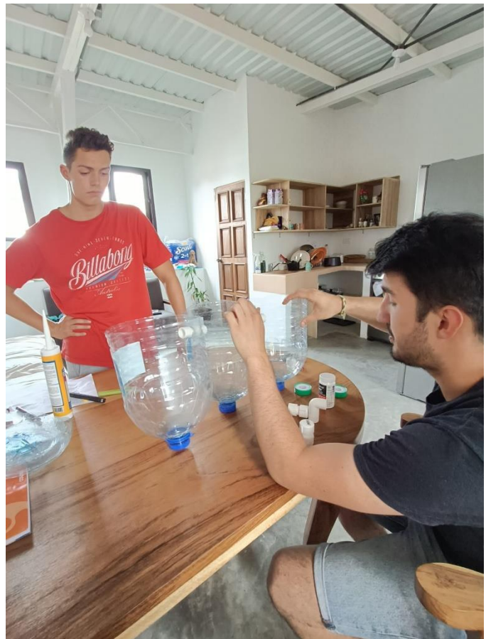
Créations bacs de décantation