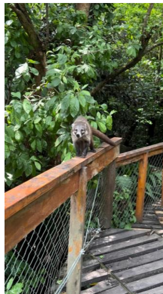
Coati de la réserve