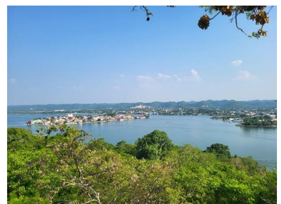
Aperçu de l'île de Flores depuis un mirador