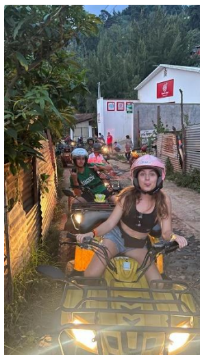
La team en quad après le Sunset