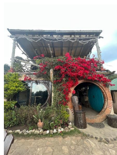
Maison de hobbit (Hobbitenango)