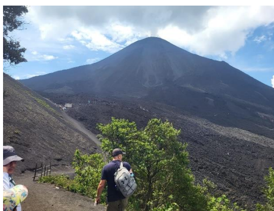
Sommet du volcan Pacaya