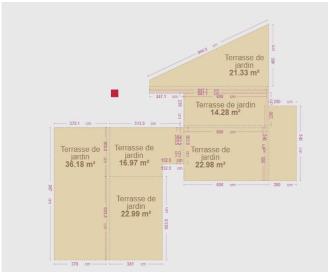
Plan en 2D du toit

Nous avons aussi pris les dimensions des panneaux solaires, réservoir et chauffe-eau afin de pouvoir les déplacer selon nos besoins.