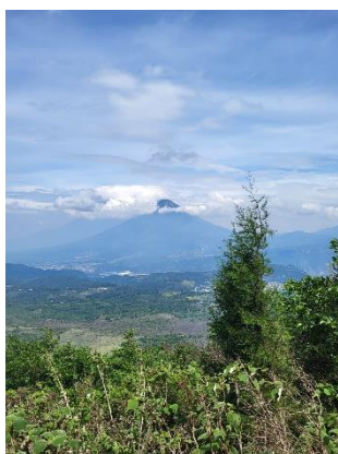
Volcan de Agua depuis Pacaya

Les plus courageux se sont levés le dimanche à 5h30 pour escalader le plus petit des volcans encore actifs du Guatemala, le volcan Pacaya.