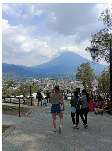
Antigua depuis Cerro de la Cruz