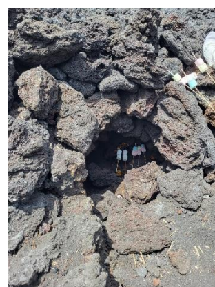
Four volcanique (Pierres volcaniques encore chaudes)